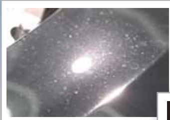
セイバーボディーコーティング未処理